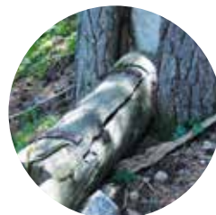
Cóm al camí