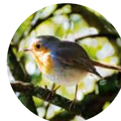
Pit-roig ( Erithacus rubecula )