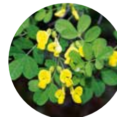
Coronilla boscana ( Coronilla emerus )