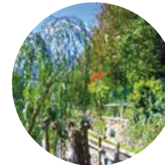
Canal d'irrigation du Solà