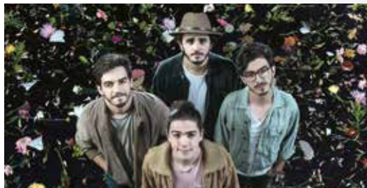
MORAT 21 H - APARCAMENT PARC CENTRAL

23.30 h: Balkan Paradise Orchestra, xaranga musical. I a partir de les 00.30h, fi de festa amb Hotel Cochambre (Versions). [Plaça Guillelmó]