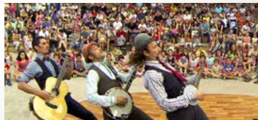
CIA. INFONCUNDIBLES 22.30 H - PLAÇA DEL POBLE