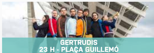
GERTRUDIS 23 H - PLAÇA GUILLEMÓ