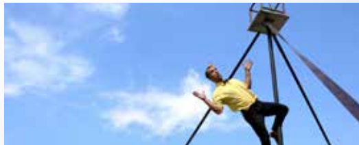
CIA. VERMUT 22 H - PLAÇA DEL POBLE