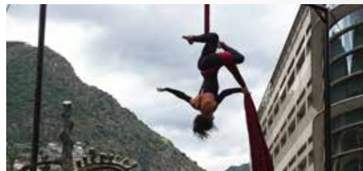
CIA. RIGUEL 18 H - PLAÇA DE LA ROTONDA