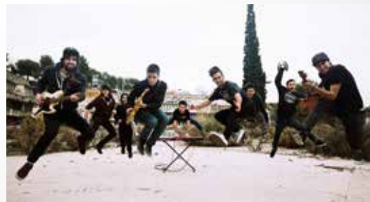
PACHAWA SOUND 2 H - PLAÇA GUILLEMÓ