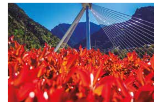
Pont de Madrid Carretera General 1 – La Margineda - Andorra la Vella