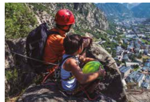
Via Ferrata de Sant Vicenç d'Enclar Accés pel carrer dels Barrers - Santa Coloma - Andorra la Vella