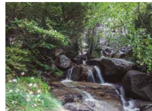
Vall d'Enclar Visites guiades durant els mesos d'estiu / Visitas guiadas durante los meses de verano / Visites guidées en été / Guided tours in summer

Reserves / Reservas / Réservations / Booking: Oficina de Turisme d'Andorra la Vella (+376) 750 100 info@oficinaturisme.ad – www.andorralavella.ad