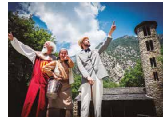
Visites teatralitzades Durant els mesos d'estiu Visitas teatralizadas durante los meses de verano Visites théâtralisées en été / Damatised tour in summer

Reserves / Reservas / Réservations / Booking: Oficina de Turisme d'Andorra la Vella (+376) 750 100 info@oficinaturisme.ad – www.andorralavella.ad