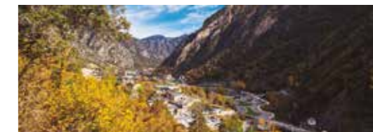
Nucli antic de Santa Coloma Nucli de la Margineda