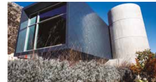
Espai COLUMBA Av. Verge del Remei, 19 - Santa Coloma - Andorra la Vella

Reserves / Reservas / Réservations / Booking: Espai COLUMBA +376 821 234 - museumandorra@gmail.com - www.museum.ad