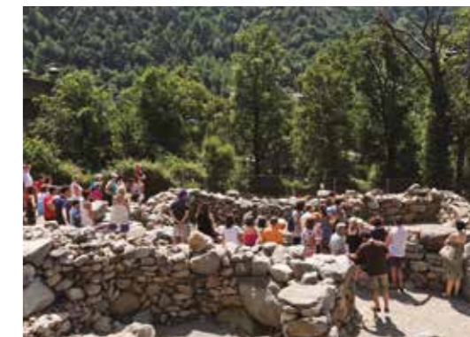
Jaciment arqueològic Roureda de la Margineda Patrimoni privat. Visites guiades durant els mesos d'estiu Visitas guiadas durante los meses de verano / Visites guidées en été / Guided tours in summer

Reserves / Reservas / Réservations / Booking: Oficina de Turisme d'Andorra la Vella (+376) 750 100 info@oficinaturisme.ad – www.andorralavella.ad