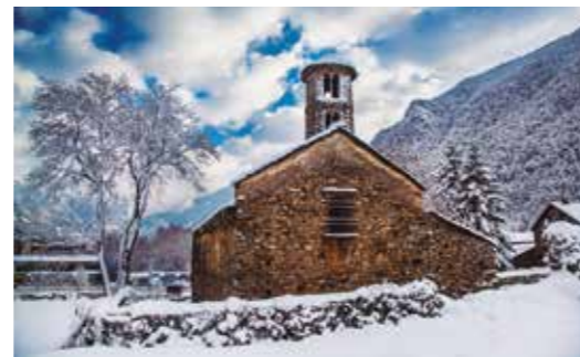
Església de Santa Coloma C/ Major - Santa Coloma - Andorra la Vella

Santa Coloma, one of the oldest and most typical villages in these valleys, lies in the south of Andorra la Vella parish. The village is the gateway to one of the most important monumental sites in the Pyrenees, including the extraordinary Church of Santa Coloma with its cylindrical belltower. The village itself conserves the street layout and several buildings typical of eighteenth-century rural Andorra. Following the traditional paths from Santa Coloma to la Margineda, we can discover the house known as the Torre dels Russos and the archaeological site at Roureda de la Margineda. Continuing southwards, we come to the Margineda Bridge and, a little further on, the Balma de la Margineda, a rock shelter where Andorra's first inhabitants lived, 12,000 years ago.