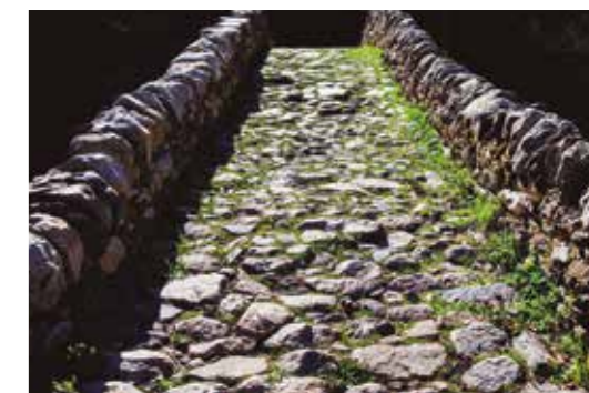
Pont de la Margineda Carretera General 1 – La Margineda - Andorra la Vella