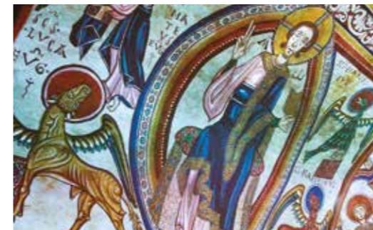
Videomapatge de l'església de Santa Coloma C. Major - Santa Coloma - Andorra la Vella

Reserves / Reservas / Réservations / Booking: +376 839 760 – museumandorra@gmail.com – www.museum.ad