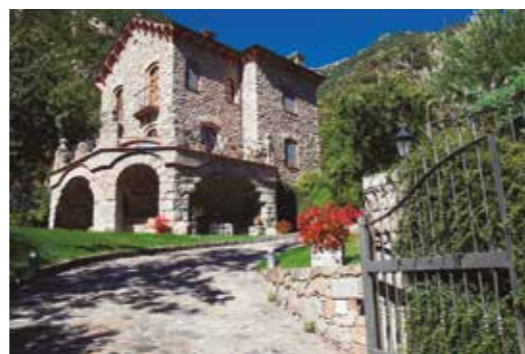
Torre dels Russos (Enclau St. Jordi) Patrimoni privat. Obra de l'arquitecte César Martinell Camí de Santa Coloma a la Margineda

Reserves / Reservas / Réservations / Booking: Oficina de Turisme d'Andorra la Vella (+376) 750 100 info@oficinaturisme.ad – www.andorralavella.ad